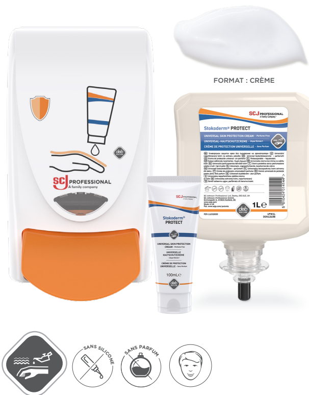
FORMAT : CRÈME