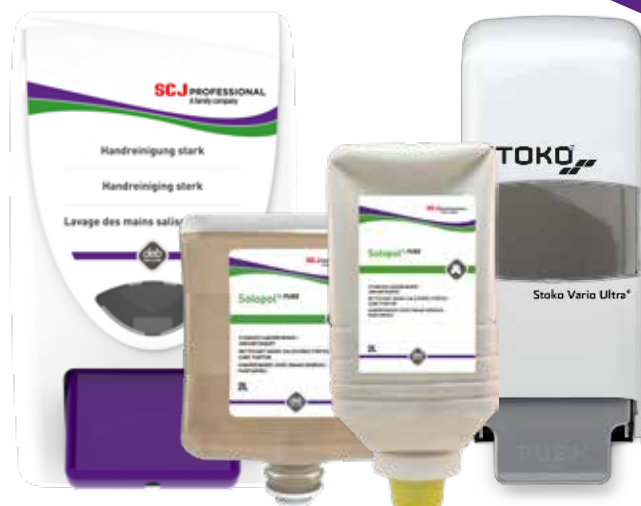
FORMAT: PÂTE D'ATELIER