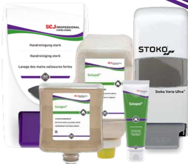
FORMAT: PÂTE D'ATELIER